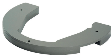
Gewicht 10 kg