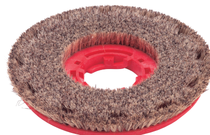
Union schrob borstel