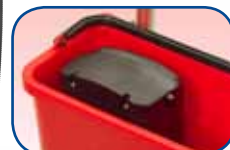
Extra batterij in de tray