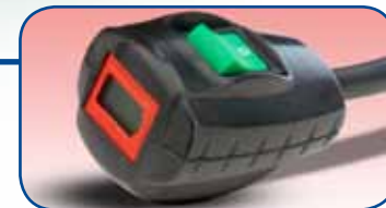
Aan/uit schakelaar en lading indicator